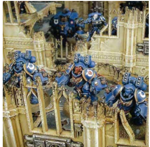
L'unité d'Astartes est masquée, chaque figurine de l'unité est au moins partiellement masquée de la vue du tireur.

Une carte par tour peut être librement défaussée lors du début de tour du joueur.