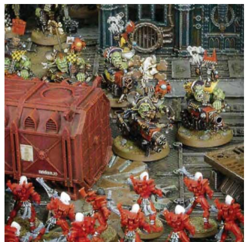
L'unité Orc n'est pas masquée car au moins une figurine de l'unité n'est pas partiellement masquée de la vue de l'unité Eldar.